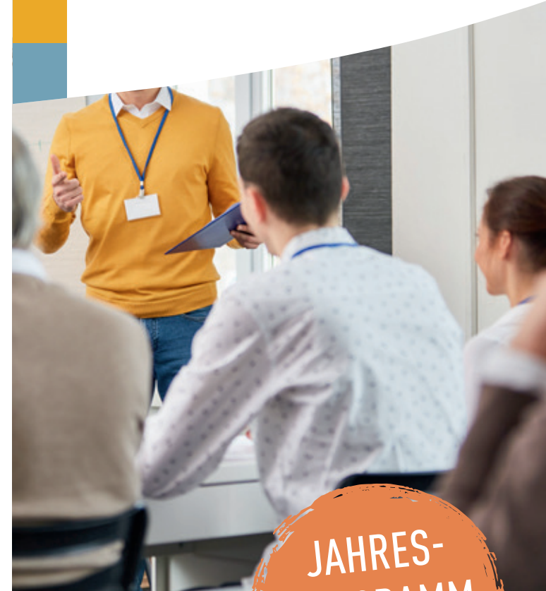
Eine Einrichtung der Gemeinnützigen Gesellschaft der Franziskanerinnen zu Olpe mbH (GFO)